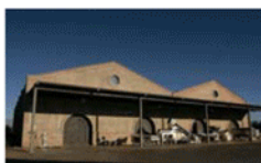
Chakana Provincia: Mendoza